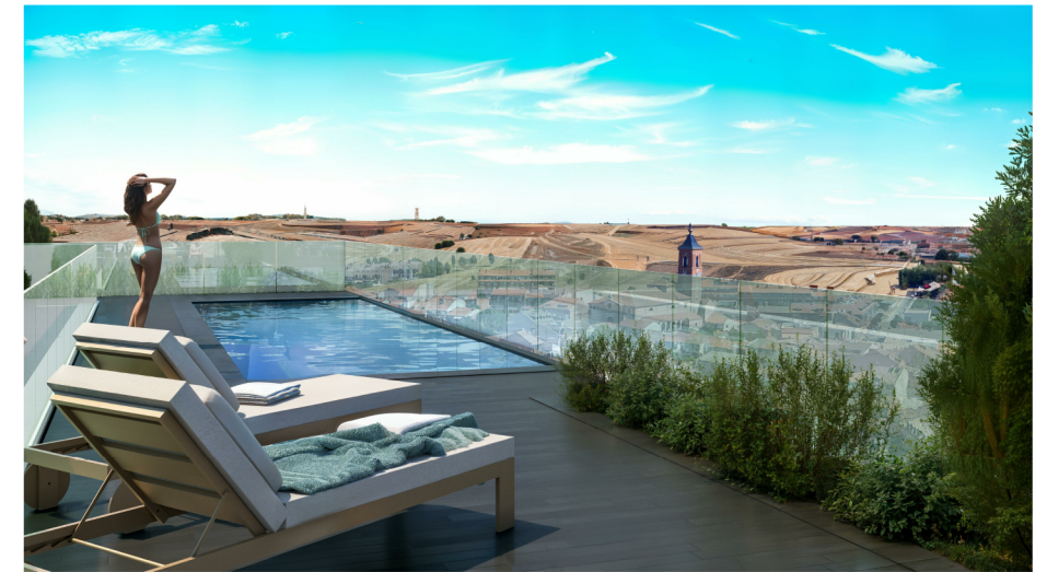
VIVIENDA 1D_1 22 Ud